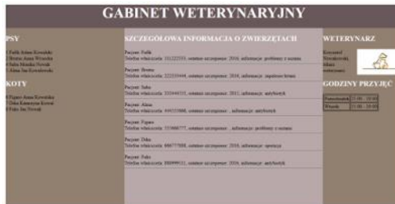
Obraz 2. Witryna internetowa